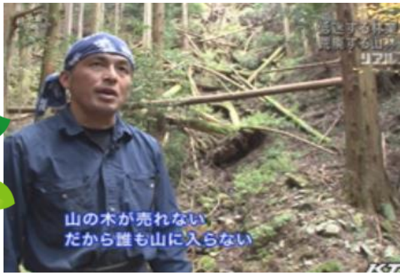
山の木が売れない だから誰も山に入らない

関西テレビの夕方のニュース「アンカー」(現在は放送終了)の17時台の特集「リアル」で放映されました。取材は、昨年11月23日と12月12日の2日間行われました。このようにメディアが取り上げてくれる事で山に関心を持って頂ける方が少しでも増え山の整備が少しずつ進む事を願います。