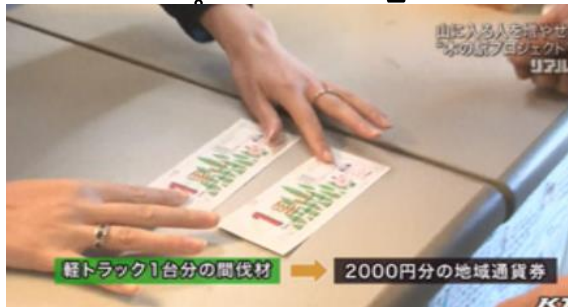
軽トラック1台分の間伐材 → 2000円分の地域通貨券